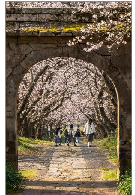
人気の桜スポットを一カ所 武雄市 円応寺