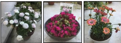
サボンマリー がレット

色とりどりの花が咲いています！！ 春らしい色とりどりの花を見て、皆さんも「きれいね」と喜ばれています☆