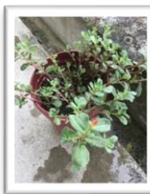
虹色ポーチュラカ